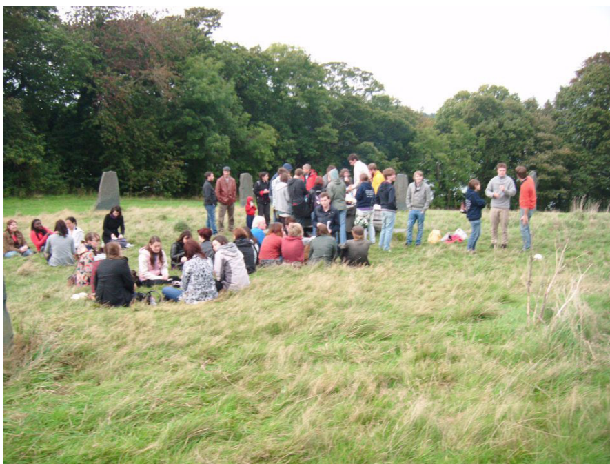
An impression of the BLS Student-Staff barbeque at the end of Freshers' Week

yr Arweinwyr Cyfoed yn llawer o help hefyd wrth geisio darganfod fy ffordd o amgylch adeiladau niferus y brifysgol a'r safleoedd neuaddau, ac roeddent yn gymorth mawr o ran teimlo'n gartrefol. Rydw i hyd yn oed yn ystyried bod yn un fy hun rŵan! FE wnes i hefyd fwynhau'r daith i Landudno, roedd yn braf cael dod i nabod yr ardal ehangach