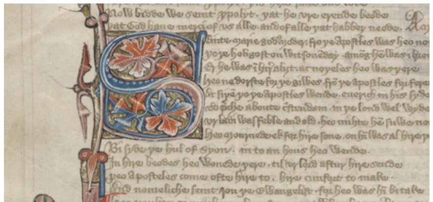
Y Llawysgrif Vernon

Am flynyddoedd y Llawysgrif, sydd yn cynnwys deunydd crefyddol yn Saesneg, Ffrangeg a Lladin oedd y cofnod mwyaf manwl a chyflawn o sut y datblygodd y Saesneg yn ystod y Canol Oesoedd. Ei brif amcan oedd rhoi gwybodaeth grefyddol i'r rhai hynny nad oeddent yn